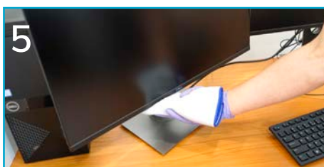
5 Przetrzyj wyłączniki monitorów oraz ekrany dotykowe.