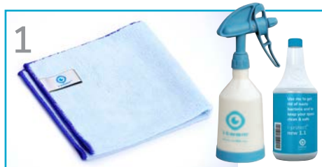
1 Załóż rękawice ochronne, przygotuj niebieską ścierkę oraz środek czyszczący/dezynfekcyjny.*