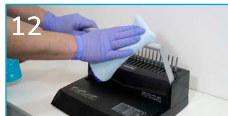
12 Przetrzyj elementy dotykowe przy innych urządzeniach biurowych (bindownica, niszczarka, itp.).