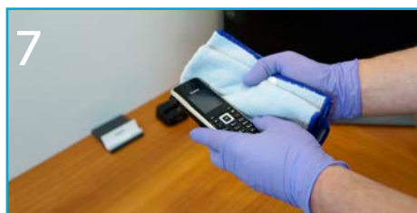
7 Przetrzyj aparaty telefoniczne i zestawy słuchawkowe.