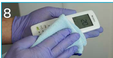
8 Przetrzyj sterowniki do urządzeń biurowych (TV, projektor, sprzęt audio, klimatyzator, itp.).