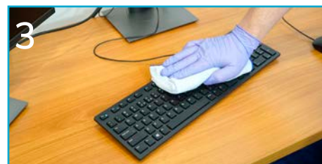
3 Przetrzyj klawiaturę komputerową.