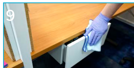
9 Przetrzyj uchwyty szafek i szuflad oraz punkty dotykowe regałów.