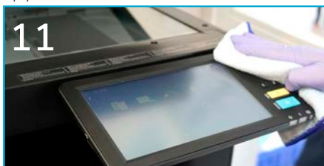
11 Przetrzyj elementy dotykowe przy urządzeniach biurowych (drukarka, kopiarka, itp.).