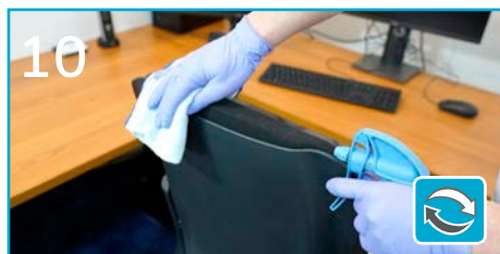
10 Przetrzyj krzesła i fotele – podłokietniki i górne powierzchnie oparcia.