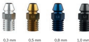
4 różne wielkości dysz krople mgły 20-150 \mu\text{m}