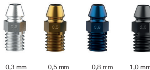
4 różne wielkości dysz krople mgły 20-150 \mu\text{m}