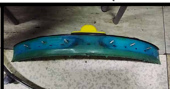
Zniszczone krawędzie, zeszywniałe od chemii i zbyt długiego używania