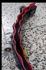
Zużyte i odkształcone