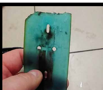
Uszkodzone na krawędziach