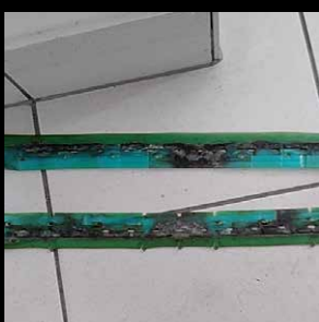
Brudne i odbarwione