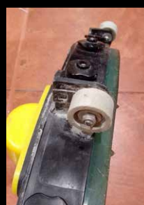
Zużyte koło podporowe ssawy