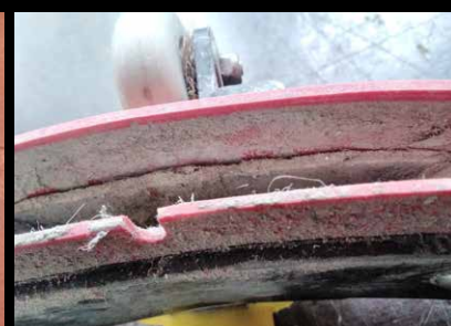
Ssawa brudna, zatkana