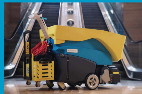
Możliwość pracy na baterii (w zestawie)

Więcej informacji na temat i-escalate: www.i-teampolska.pl