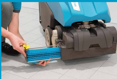
Głowica 2-szczotkowa, każda szczotka zasilana osobnym silnikiem